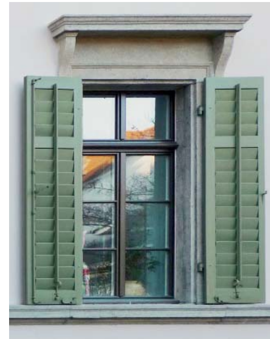
Abb. 2: Fensternachbau mit Isolierverglasung in bauzeitlicher Farbigkeit, Foto 2010. Ostfassade.