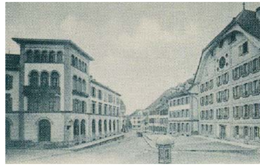
Originale Befensterung, dunkle Farbfassung der Fenster, 19. Jh., Foto um 1900.