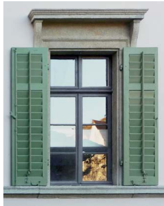
Abb. 1: Originalfenster mit Einfachverglasung in bauzeitlicher Farbigkeit nach der Konservierung im Jahr 2010. Ostfassade.

Ein Vergleich der beiden Nachzustandfotos (Abb. 1 und 2) zeigt, dass die Fenster in Fern- und Nahwirkung durch die Übernahme der Teilung, der Profile und der Farbfassung eine hohe Ähnlichkeit aufweisen. In den Detailschnitten (Abb. 3 und 4) werden jedoch die konstruktiv und bauphysikalisch bedingten Differenzen in Profilierung, Sprossierung und Materialstärken sichtbar: Der Fensternachbau mit adaptierten Standardprofilen unterscheidet sich klar von den bauzeitlichen Fenstern.