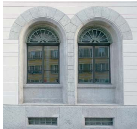
Fensternachbau, Foto 2010.